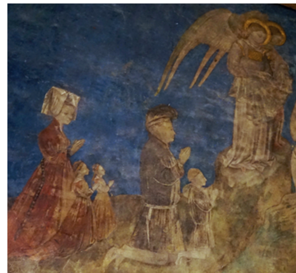
Fresque du XIV e s., cathédrale d'Avignon